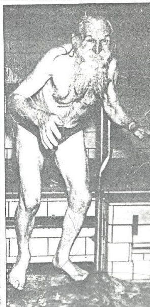
● Vid sidan av cykling var Stålfarfar en entusiastisk badare. Badhuset i Helsingborg besökte han ofta.